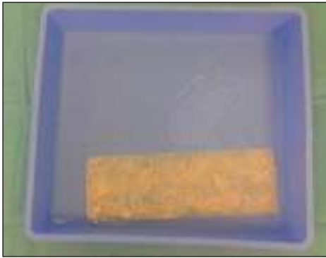
Obr. 1. Duralní grafit připravený k aplikaci po 2 min naložení do fyziologického roztoku.

Fig. 1. The dural graft is ready to use after 2 min in rehydration fluid.