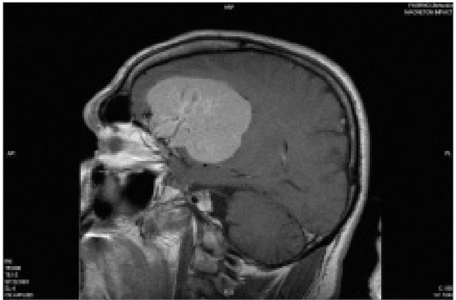
Obr. 1. Snímek MRI; sagitální řez s nálezem tumoru vyrůstajícího z báze přední jámy lební s bohatým cévním zásobením.

55letý muž, bez zátěže v rodinné i osobní anamnéze, uváděl asi 12 měsíců trvající bolesti hlavy, slabosti končetin a zhoršení zraku do dálky. CT vyšetření provedené v nemocnici v Kyjově prokázalo objemný tumor charakteru meningiomu fronto-temporo-parietálně vlevo s origem na bázi lební nad očníci a arachnoideální cystou temporopolarně vpravo. Nález byl verifikován i magnetickou rezonancí (obr. 1). Pacient byl přijat na neurochirurgickou kliniku Fakultní nemocnice Brno, kde byla provedena v říjnu 2005 totální exstirpace tumoru. Dobře ohraničený tumor o rozměrech 8 × 6 × 6 cm expanzivně prorůstal do postranní komory, komunikace o rozměrech 2 × 2 cm vzniklá po exstirpaci tumoru byla překryta spongostanem. Operační výkon byl provázen krevní ztrátou 4 l, která vyplývala z charakteru nádoru. Jednalo se o velmi objemný mezenchymální bohatě vaskularizovaný nádor s odlišením na bázi lební. Po výkonu byl pacient na řízení ventilací. Třetí pooperační den byla provedena revize pro hematoma v operačním lůžku, po kontrolním CT. 7. pooperační den byl pacient odtlumen a převeden na spontánní ventilaci. 16. pooperační den