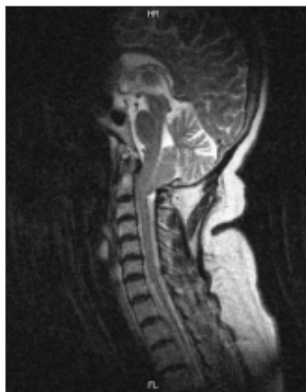
Obr. 3. MRI vyšetření 52leté ženy s Chiariho malformací typu I B.

Žena, 52 let. Několik let trvající obtiže charakteru ventilových bolestí hlavy. Na MRI Chiariho malformace typu I B. Provedena dVTO, laminektomie C1, plastika dura mater. Úplná úprava subjektivních obtiží. Kontrolní MRI uspokojivé, kraniocervikální přechod volný.