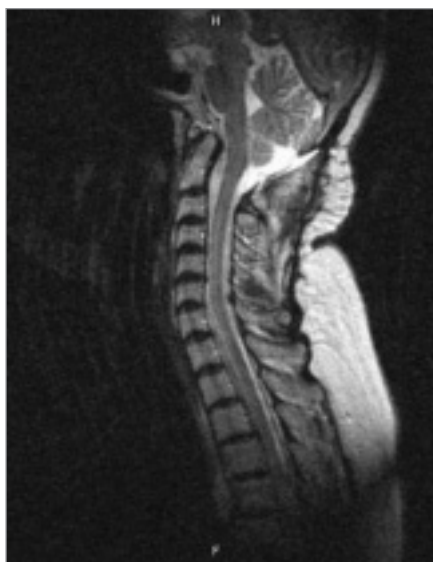
Obr. 4. kontrolní MRI vyšetření s odstupem 10 měsíců od operace.

Chiariho malformace typu I A se syringomyelií Th1–Th8. Provedena dVTO, laminektomie C1, C2, resekce tonzil, plastika dura mater.