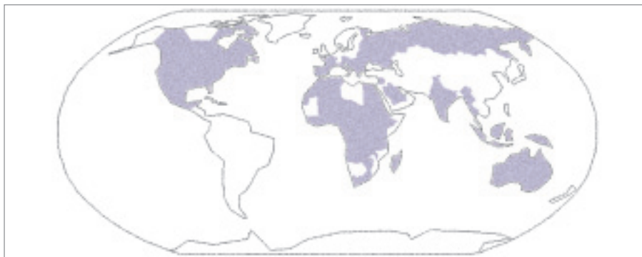
Obr. 1. Země s možným přenosem západonilské horečky (Upraveno dle Tsai TF et al. Flaviviruses. In: Mandell GL, Bennett JE, Dolin R (eds). Principles and practice of infectious diseases. 6th ed. Philadelphia: Elsevier; 2005: 1927.

V ČR již v roce 1979 prokázali Grešíková et al, že hemaglutinaci inhibující protilátky k WNV se vyskytovaly v jižních Čechách u 2 % krav i koní a u 4 % zajíců. Začátkem 90. let prokazuje Juřicová et al protilátky k WNV na jižní Moravě u 8 % lovné zvěře (daňků, divokých prasat, zajíců) a u 10 % kormoránů [6]. Po povodni roku 1997 byly neutrali-