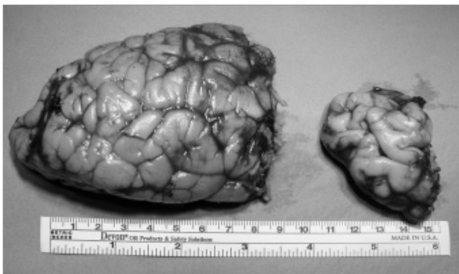
Obr. 2. Pacient 2, dívka 7 měsíců. (Stp. anatomické hemisférektomie. Četnost EP paroxů snížena, spastická hemiparéza).

MR, T1 axiální řez: hemimegalencefalie III. typu: zřetelná asymetrie ve velikosti hemisfér, asymetrie komorového systému, typické vtažení frontálního rohu posttranní komory postižené hemisféry.