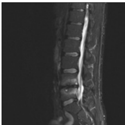
Obr. 3. MR 12 měsíců po operaci ALIF stand-alone (Visios) v prostoru L4/5 pro FBSS u stejného pacienta. Vyšetření ve STIR prokazuje výrazné Modicovy 1 změny (hyperintenzivní) a dokonce drobné hyperintenzivní cysty subchondrálně v obou obratlových tělech. Sagitální zobrazení ve střední čáře.