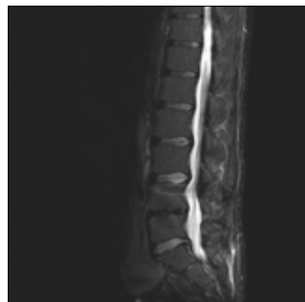
Obr. 4. MR šest měsíců po doplnění zadní transpedikulární fixace L4–5 pro selhání ALIF stand-alone (Visios) u stejného pacienta. Vyšetření ve STIR prokazuje vymizení Modicových změn a kostních cyst. Sagitální zobrazení ve střední čáře.