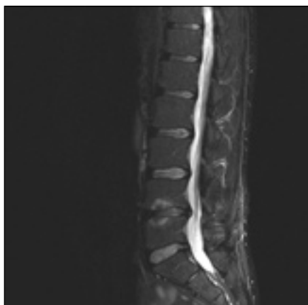
Obr. 2. MR šest měsíců po operaci hernie disku zprava v prostoru L4/5. Vyšetření ve STIR prokazuje výrazné snížení disku, hypointenzitu disku a Modicovy 1 změny (hyperintenzivní). Sagitální zobrazení ve střední čáře. Muž, 42 let.