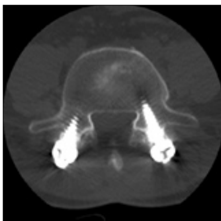
Obr. 6. CT snímek šest měsíců po doplnění zadní transpedikulární fixace L4–5 pro selhání ALIF stand-alone (Visios) u stejného pacienta. Vyšetření prokazuje vymizení cystických změn na styčné ploše obratlového těla L5 a implantátu. Axiální sken.

nemocní měli na MR změny typu Modic 1 a pět z nich mělo na CT známky kostních cyst. Ve všech případech byla doplněna zadní transpedikulární fixace (Legacy, Medtronic, USA) operovaného segmentu. Při hodnocení po šesti měsících se u těchto pacientů snížil VAS z průměrných 8,00 na 6,17 a ODI z průměrných 57,33 na 39,52. Kořenové dráždění ustoupilo u tří nemocných a zmírnilo se u dalších tří. Zlepšení klinického stavu odpovídaly po šesti měsících i změny na CT a MR. K vymizení cystických změn na CT došlo u dvou pacientů a ke