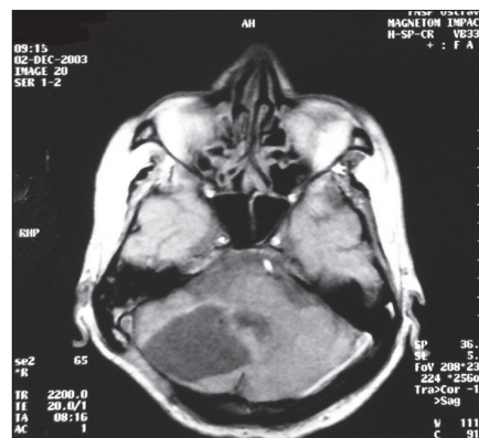
Obr. 2. Magnetická rezonance – rezidua po aktinomykóze v mozečku.

Pacient byl do obdržení výsledku histologického vyšetření 12 dnů léčen cefotaximem (6 g denně), amikacinem (1 g denně) a ketokonazolem (200 mg denně). Po obdržení histologického nálezu byl pacient přeložen na Klinikou infekčního lékařství FN Ostrava a tam byla zahájena intravenózní léčba benzylpenicilinem v dávce 40 milionů jednotek denně. Při přijetí byl pacient o hmotnosti 71 kg afebrilní, imobilní, s pravostrannou neocerebellární symptomatologií. CT plic prokázalo pruhovité stíny v pravém horním laloku dosahující od struktur mediastina až ke stěně hrudní. Bronchoskopické vyšetření vyloučilo tumor plic, kultivace bronchoalveolární laváže byla negativní. Ve druhém týdnu hospitalizace měl pacient krátkodobý delirantní stav, který byl zvládnut neuroleptiky a antipsychotiky, vzhledem k afebrilnímu průběhu a rychlému zlepšení stavu nebyla provedena lumbální punkce. Pacient byl dva měsíce imobilní. Onemocnění se komplikovalo bakteriální bronchopneumonií, hypotenzí s nutností dlouhodobé léčby vazopresory a vznikem sakrálního dekubitu. Celková doba léčby benzylpenicilinem byla 60 dnů, denní dávka 40 milionů jednotek byla rozdělena do čtyř dávek, podávána byla do centrální žíly. Pacient léčbu toleroval dobře. Pro léčbu komplikací byl navíc aplikován ciprofloxacin, chloramfenikol, fluconazol a další symptomatická léčba. Do jednoho roku od operace následovala perorální léčba fenoxymetylpenicilinem v dávce 4,5 milionů jednotek denně.