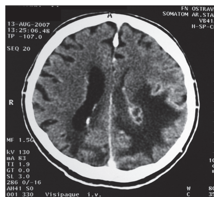
Obr. 4. CT mozku – progresse abscesu okcipitálně vpravo.

byly prokázány mikroorganismy rodu Aspergillus . Na snímku plic během života pacienta nebyl patologický nález zřetelný, ale CT plic nebylo provedeno. Je pravděpodobné, že se jednalo o ložisko aktinomycózy v plicích, které bylo primárním zdrojem pro mozkovou aktinomycózu. Ložisko v plicích bylo asi následně kolonizováno aspergily v průběhu onemocnění.