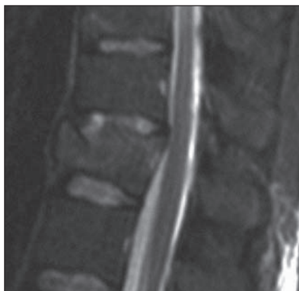
Obr. 2. MR ve STIR-módu v sagitální rovině ve střední čáře. Muž, 44 let, fraktura obratle Th12 typu A3.3.1. Poranění disku 4. stupně dle Onera. Pacient byl indikován ke kombinované stabilizaci (Skupina 2).