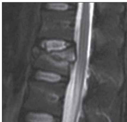
Obr. 1. MR ve STIR-módu v sagitální rovině ve střední čáře. Muž, 28 let, fraktura obratle L1 typu A3.1.1. Poranění disku 4. stupně dle Onera. Pacient byl indikován k zadní transpedikulární fixaci (Skupina 1).