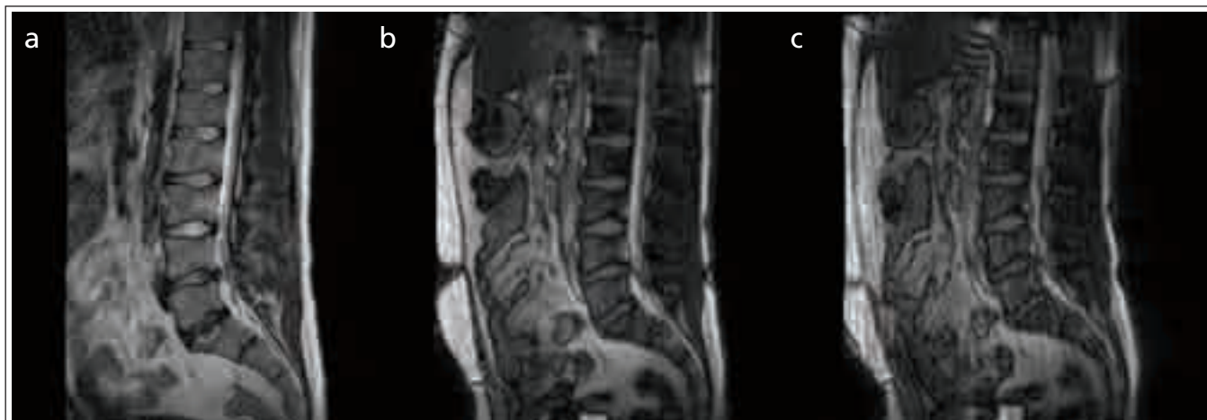
Obr. 4a–c. MR a dMR vyšetření z dne 2. 6. 2009.