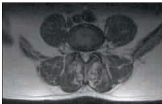
Obr. 2. MR L4/5, axiální sken, T2 – vážený. Cysta je resorbována. Po operaci 9 měsíců.