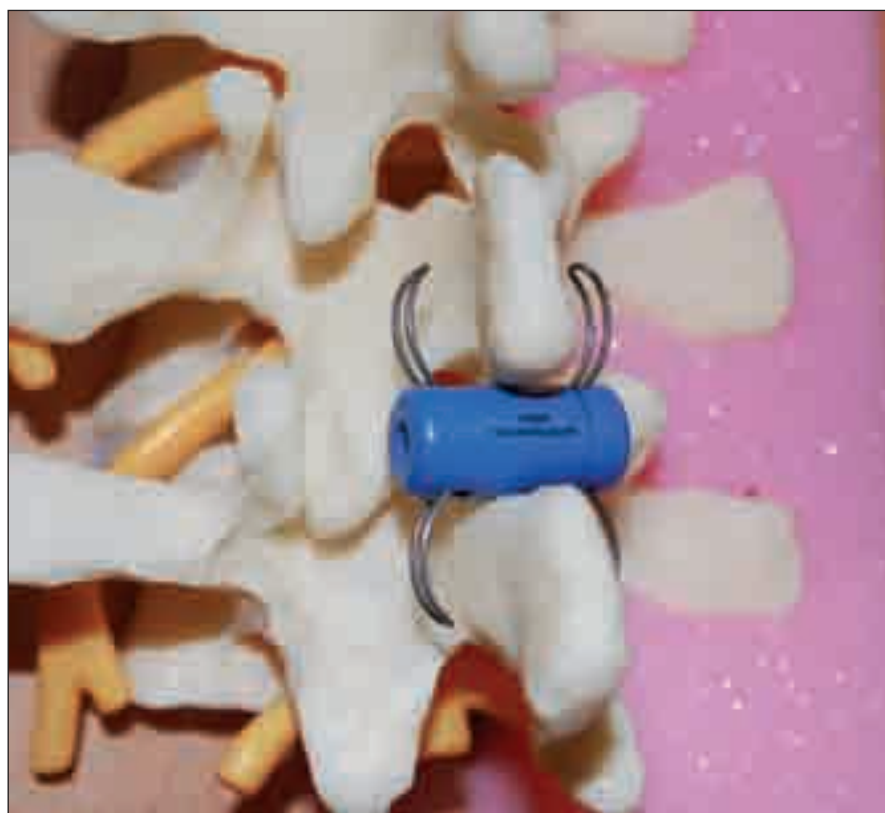
Obr. 3. Model bederní páteře s pozicí implantátu In-Space mezi spinózními výběžky.

cysty, ale ověření proběhlo jen na základě CT vyšetření [9]. Konzervativní forma léčby je klid na lůžku, medikace analgetik a anti-revmatik, fyzioterapie, korzetoterapie, transkutánní elektrostimulace, epidurální nebo intraartikulární injekce steroidů a aspirace cysty. Konzervativní terapie ale nebývá většinou dostatečně účinná a efekt zajistí až chirurgické odstranění cysty [5].