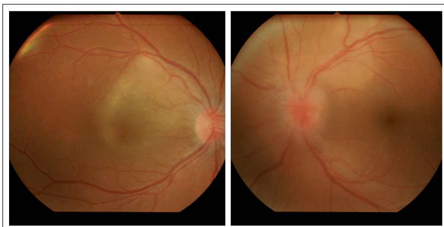
Obr. 1. Vstupní náález na fundu pravého a levého oka.

V časně fázi fluorescenční angiografie pravého oka bylo patrné rozsáhlé choroidální ložisko, které tvořila mnohčetná, splývající hyperfluorescentní lo-