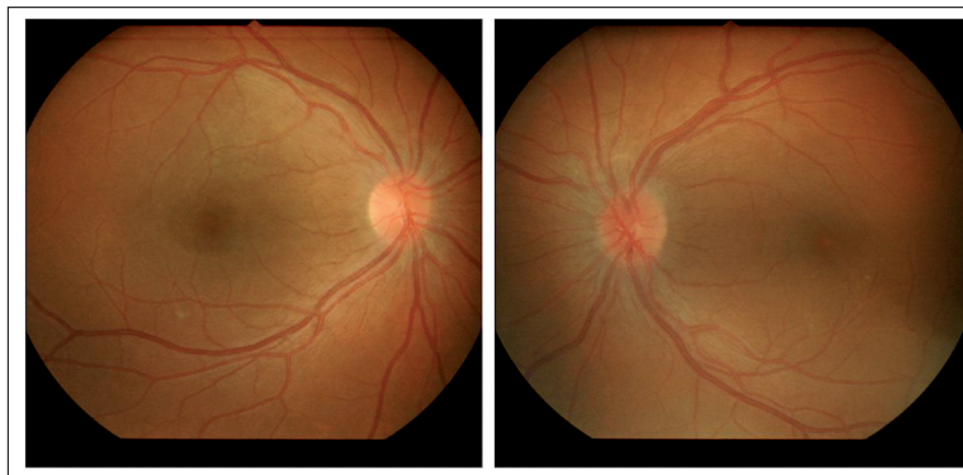
Obr. 4. Nález na fundu pravého a levého oka 20 dní po zahájení terapie.

nitální či získané infekce. U kongenitální syfilis oftalmoskopický nález připomíná onemocnění retinitis pigmentosa s charakteristickými chorioretinálními pigmentacemi charakteru „pepř a sůl“ a bývá bez výrazných nitroočních zánětlivých změn. U získané syfilis je chorioretinitis obvykle přítomna v sekundárním stadiu onemocnění a bývá bilaterální. Je charakterizována mnohočetnými žlutobělými subretinálními ložisky a přítomností výrazné retinální perivaskulitis v zadním pólu oka. Na fluorescenční angiografii vykazují tyto léze hyperfluorescenci, včetně terče zrakového nervu [6].