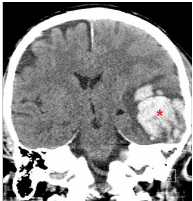
Obr. 2. Kontrolní CT s progresí kontuze (*).

*Rozvíjející se kontuzní ložisko temporálně vlevo.