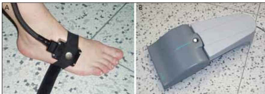
Obr. 1a) Termosonda, připevněná na nárt pravé dolní končetiny ve vyšetřované lokalizaci (dorsum nohy v oblasti nad musculus extensor digitorum brevis).

Kvantitativní testování senzitivity (QST) bylo provedeno pomocí elektrodiagnostické jednotky Nicolet Viking IV a příslušného specializovaného softwaru v tichém, klidném prostředí a při maximálním pohodlí pro vyšetřovaného, aby byla co nejméně narušena schopnost jeho koncentrace. Termické prahy (TPT) byly hodnoceny s využitím softwaru Neurosensory analyser – model TSA-II (Medoc TSA 2001; Medoc Ltd., RamatYishai, Israel) a termosondy 2,5 × 5 cm (obr. 1a). Vyšetření bylo provedeno na dorzu pravé nohy (resp. kontralaterálně k distribuci vertebrogenních obtíží) v oblasti nad musculus extensor digitorum brevis (dermatom L5). Na základě pilotní studie zaměřené na QST provedené na našem pracovišti [5] byly pro vyšetření zvoleny dvě metody reakčního času (tj. nerandomizovaná a randomizovaná varianta metody Limity) a jedna metoda konstantního stimulu (Úrovně). Každou z uvedených metod byl vyšetřen práh pro vnímání tepla (Warm Sensation, WS) a chladu (Cold Sensation, CS) v dané lokalizaci, a to ve vyšetřovaném tepelném rozsahu 0–50 °C (který nemůže být během vyšetření překročen z důvodu prevence termického poškození tkání pacienta). Výchozí, tzv. adaptační teplota je pro všechny testy 32 °C (jedná se o neutrální teplotu, při níž naprostá většina vyšetřovaných jedinců nevnímá teplo ani chlad). Rychlost nárůstu a poklesu teploty podnětu je 1 °C/s, interstimulační interval pak 4–6 sekund. Před provedením každého z testů je pacient detailně instru-