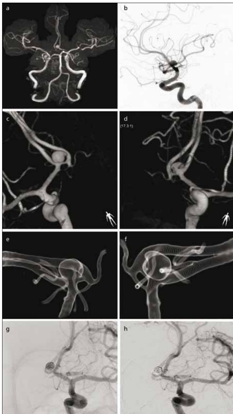
Obr. 3a) 46letá žena, hypertonička s náhodně nalezeným aneuryzmatem a. communicans anterior velikosti 7 mm s naznačeným sekundárním vakem na MR provedené pro záchvatové bolesti hlavy. Obr. 3b) Boční projekce angiografie ukazuje orientaci vaku kraniálně. Obr. 3c–f) Trojrozměrná subtrahční angiografie ukazuje možnosti zobrazení detailu aneuryzmatu včetně zdvojené a. communicans anterior. Obr. 3g) V témže sezení v celkové anestezii zavedena první spirála tak, aby co nejvíce vyplnila objem vaku. Obr. 3h) Pak byly doplněny další 3 spirály do plného uzavěru vaku. Čas celkové anestezie nepřesáhl 60 min.

lárně. Nemocní s neléčenými aneuryzmaty byli rozděleni na skupiny s aneuryzmatem lokalizovaným v přední cirkulaci a zadní cirkulaci, zahrnující též aneuryzmata při odstupe a. communicans posterior.