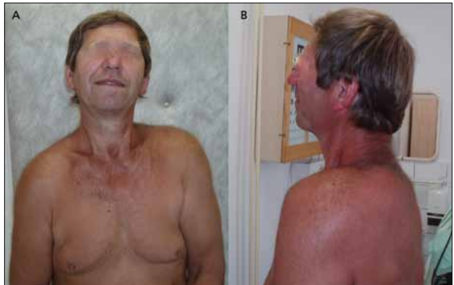
Obr. 3a) Osmapadesátiletý muž s cervikální dystonií s výraznou elevací levého ramene a lopatky.

Mezi kontraindikace podání botulotoxinu patří těhotenství, laktace, známá alergie na botulotoxin (či protein v daném preparátu), poruchy neuromuskulárního přenosu (myastenie, myastenický syndrom), některé nervosvalové choroby (těžší neuropatie), poruchy hemokoagulace (INR nad 2,8), lokální zá-