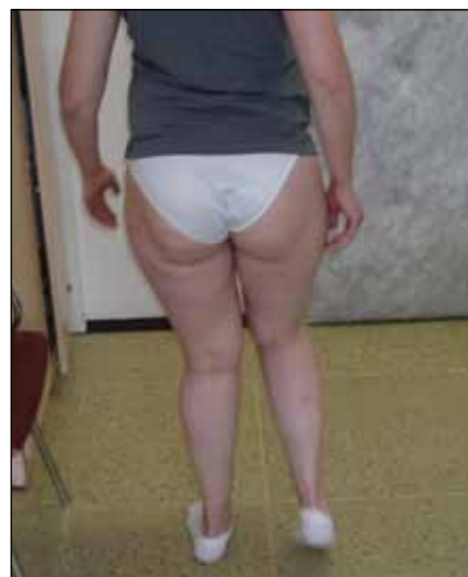
Obr. 13. Čtyřiatřicetiletá žena s DMO. Flekční a addukční spasticita stehen, extenční bérců.

Blefarospasmus se provokuje prudkým nebo intenzivním světlem, námahou očí, akcentuje se ve stresové situaci. Tito nemocní pak mají problémy se čtením, psaním, sledováním televize, řízením, často pak nejsou schopni přejít silnici – v této stresové situaci se provokuje trvalá kontrakce orbikulárních svalů. Spazmy se sevřením víček mohou být zmírněny či blokovány mluvením, zíváním, zpíváním anebo jinými „senzorickými triky“. Závažnost blefarospasmu se může hodnotit podle různých škál. Jankovičova škála hodnotí mrkání, třepotání víček a spazmy víček. Přitom vždy vyjadřuje tíži a frekvence jednotlivých příznaků [3]. BSDI (The Blepharospasm Disability Index) posuzuje postižení specifických každodenních aktivit – čtení, sledování televize, nakupování, chůze, denní aktivity a řízení. Každé položení přisuzuje 0–4 body. Nemocní s blefarospasmem mají sníženou kvalitu ži-