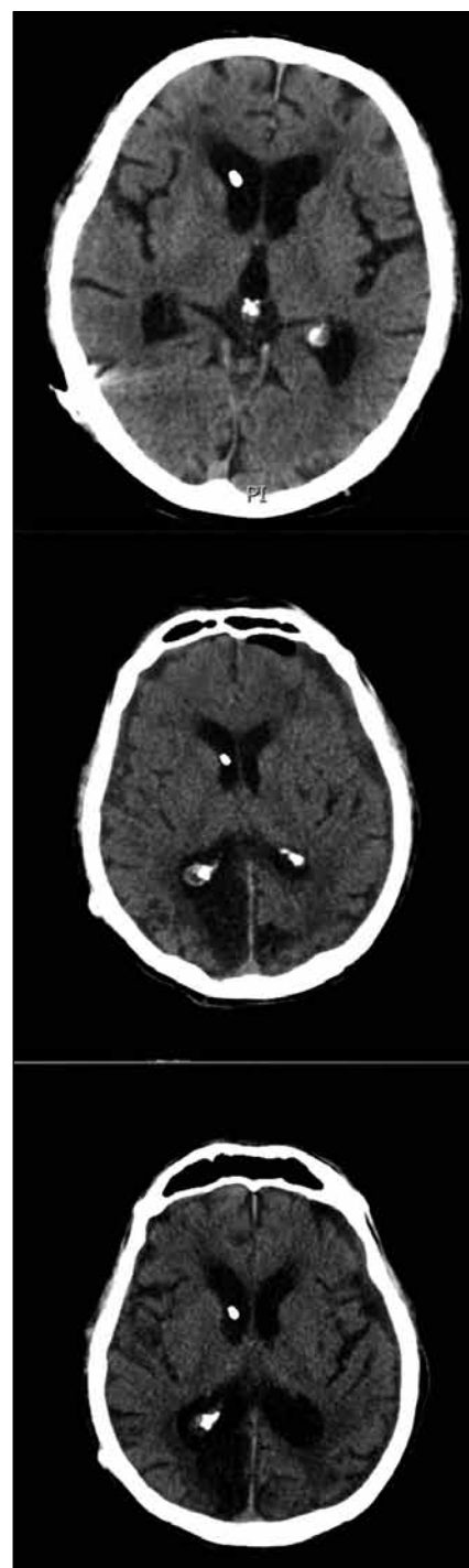
Obr. 1. Pacient komplikovaný předrénováním – chronický subdurální hematom (snímek uprostřed) na vyšetření pomocí výpočetní tomografie. Navíc je nově okcipitálně vpravo stav po proběhlém iktu, který v časném období po implantaci shuntu nebyl patrný (horní snímek). Po revizi – trepanaci a evakuaci chronického subdurálního hematomu a korekci zkratového systému – je vidět regrese velikosti SDH (dolní snímek).