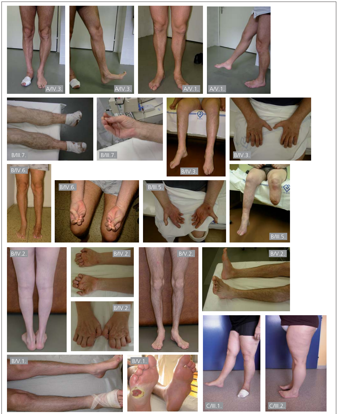
Obr. 2. Fotografie pacientů s dědičnou senzitivní neuropatií.

Písmeno značí rodinu pacienta, identifikační čísla pacientů jsou stejná jako v tab. 1 a 2 a rodokmenech. U pacienta B/V.1. je již pokročilý defekt, který bývá právě na ploskách nohou pro tyto pacienty typický.