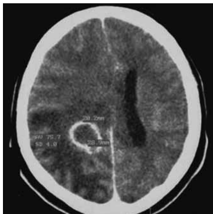
Obr. 1. CT po podání kontrastní látky ukazuje kulovité ložisko (20 × 28 × 15 mm) s enhancujícím prstenčítým lem v hloubce pravé mozkové hemisféry. Kolaterální edém způsobuje středočárový přetlak 13 mm.

s decerebrační reakcí končetin a pravostrannou mydriázou. CT mozku ukázalo progresi kolaterálního edému a středočárového přetlaku, abscesová dutina byla parciálně kolabovaná (10 × 17 × 10 mm) (obr. 2). Akutně jsme provedli pravostrannou dekompresivní hemikraniektomii. Po operaci se během několika dnů klinický obraz nemocného téměř upravil, přetrvávala inkompletní levostranná hemianopsie (obr. 3). Z punktátu byl vykulitován Peptostreptococcus a Fusobacterium necrophorum . Přestože na penicilin byly citlivé oba druhy bakterií, terapie byla posílena cefazolinem (4 × 1 g/24 hod). V uvedené dvojkombinaci antibiotik bylo pokračováno po celou dobu hospitalizace. Kortikoidy byly po dekompresi vysazeny, ve frakcionovaném podávání 20% manitolu bylo pokračováno až do zmírnění expanzivních projevů na grafickém vyšetření. Kontrolní CT 25. pooperační den ukázalo regresi edému a pouze drobné reziduum abscesového ložiska (obr. 4). Po 29 dnech od dekomprese byla provedena replantace kostní ploténky. Nemocný byl přeložen na neurologii 45. pooperační den při jasném vědomí, bez poruchy hybnosti s parciální levostrannou hemianopsií. Antibiotika byla vysazena po devíti týdnech hospitalizace, kdy dle MR kontroly byl absces zhojen a zánětlivé parametry v normě. Při ambulantní kontrole šest týdnů po propuštění byl nemocný subjektivně bez potíží, objektivně s rezii