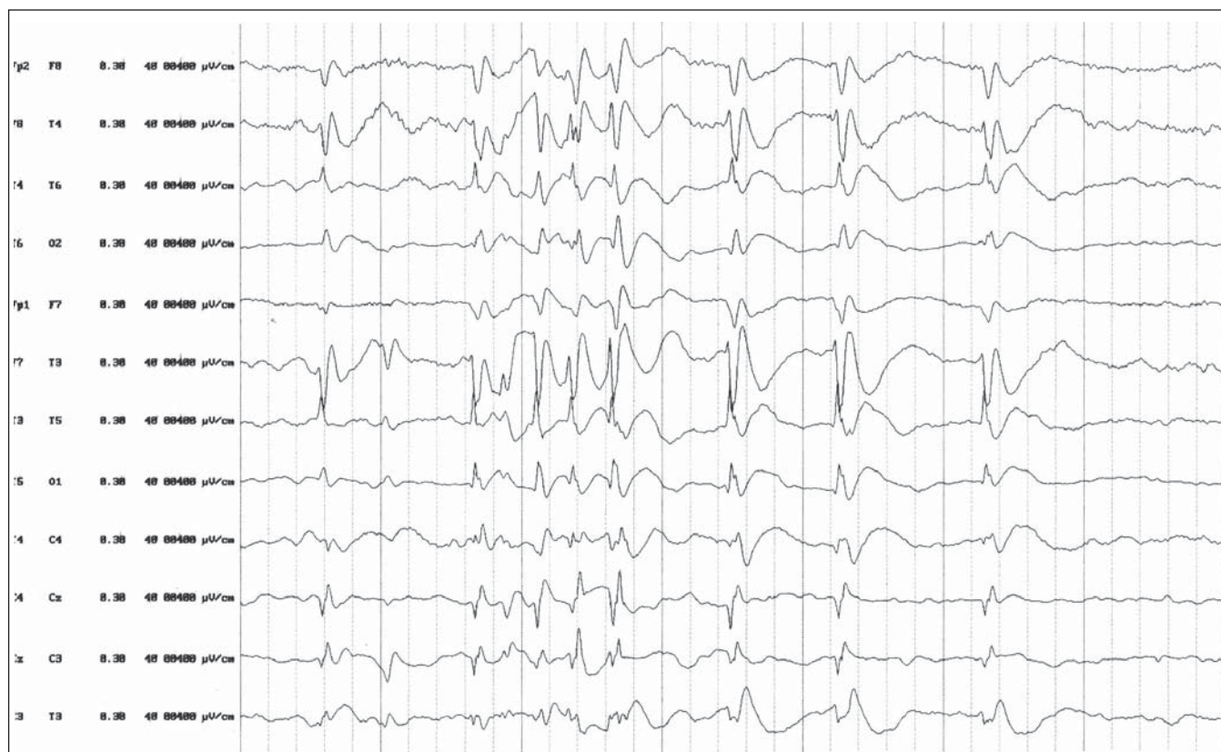
Obr. 1. EEG nález pred nasadením liečby ACTH. V spánkovom zápise sú prítomné dve nezávislé ohniská v temporálnych zvodoch obojstranne s generalizáciou.

liečbu ESES. Záchvaty nie sú hlavným problémom, keďže ich výsledná prognóza je väčšinou priaznivá. Predpokladá sa, že epileptiformné zmeny sú zodpovedné za vznik porúch reči, behaviorálnych a iných neuropsychologických zmien, a preto cieľom farmakologickej liečby je ich potlačenie. Liečba ESES je úplne empirická a väčšinou len s dočasným efektom.