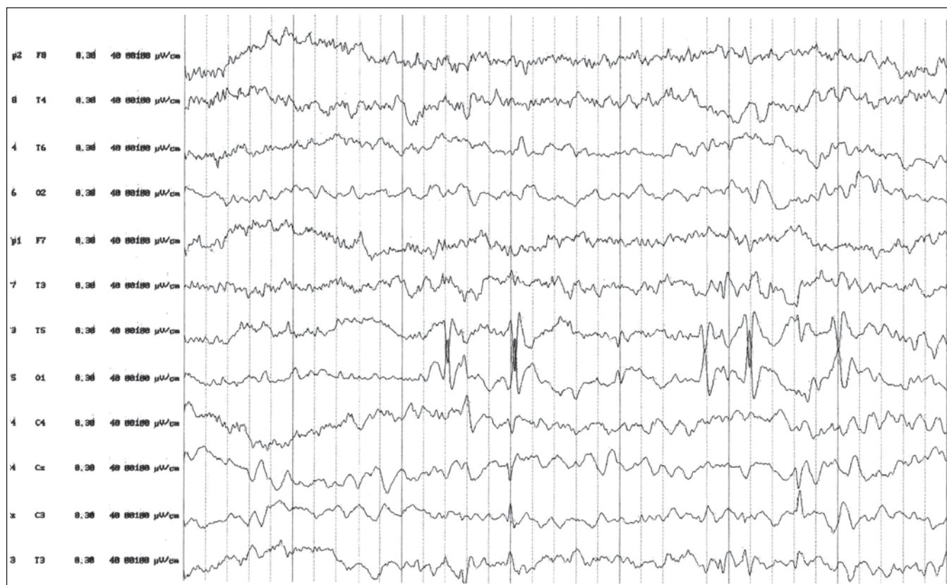
Obr. 2. EEG pri liečbe ACTH. Výrazné zlepšenie spánkového EEG zápisu. Pretrvávajúca ložisková epileptiformná aktivita temporálne vľavo s vymiznutím generalizácie.

mesiacov bola opakovane menená antiepileptická liečba – vystriedané antiepileptiká nitrazepam, valproát, topiramát a klobazam boli bez výraznejšieho efektu. V tomto období (vo veku 3,5 roka) sa pridružili poruchy reči v oblasti perцепčnej aj expresívnej. V psychologickom vyšetrení boli intelektové výkony v rámci širšieho populačného priemeru, zaostávanie v oblasti reči, sociálneho vývinu a perцепcie. V spánkovom EEG boli prítomné dve nezávislé ohniská v temporálnych zvodoch obojstranne s generalizáciou (obr. 1).