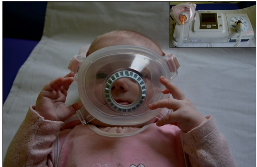
Obr. 1. Celoobličejová maska pro použití u novorozence. V pravém horném rohu ventilační přístroj Philips BiPAP A40.

Po genetické confirmaci se ve spolupráci s Oddělením dětské neurologie FN Ostrava, kam byly obě pacientky přeloženy, podařilo najít efektivní systém domácí spánkové neinvazivní ventilační podpory s využitím speciální celoobličejové masky pro novorozence (obr. 1). Nejlépe vyhovujícím ventilačním přístrojem se ukázal být Philips BiPAP A40 (režim Bi-level Positive Airway Pressure). Po seznámení rodičů s obsluhou přístroje