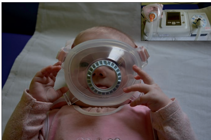
Obr. 1. Celoobličejová maska pro použití u novorozence.

Po genetické konfirmaci se ve spolupráci s Oddělením dětské neurologie FN Ostrava, kam byly obě pacientky přeloženy, podařilo najít efektivní systém domácí spánkové neinvazivní ventilační podpory s využitím speciální celoobličejové masky pro novorozence (obr. 1). Nejlépe vyhovujícím ventilačním přístrojem se ukázal být Philips BiPAP A40 (režim Bi-level Positive Airway Pressure). Po seznámení rodičů s obsluhou přístroje