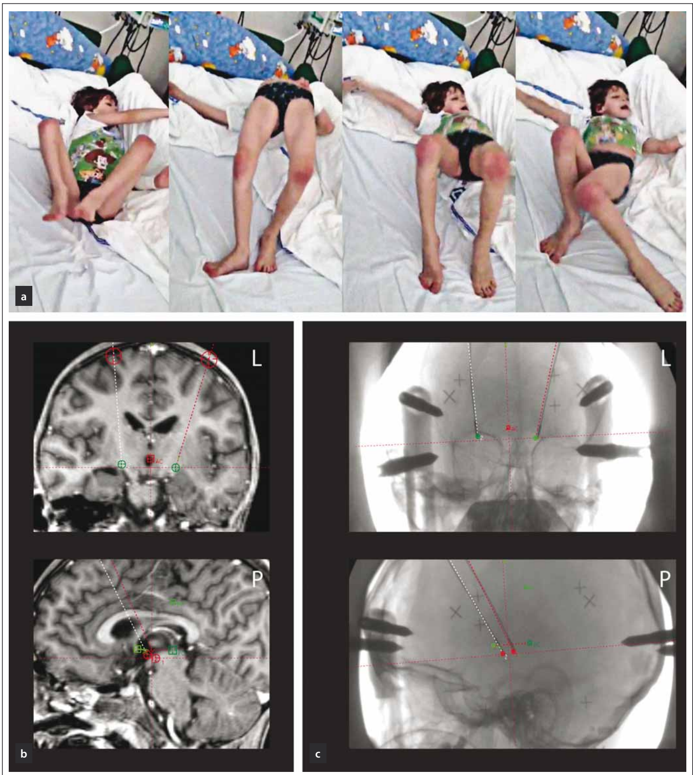
Obr. 2. Pacient 2 (DYT-1) s rozvojem status dystonicus.

Obr. 2a) Status dystonicus s projevy těžké fázičké trupové dystonie s opistotonem a balistickými pohyby končetin.