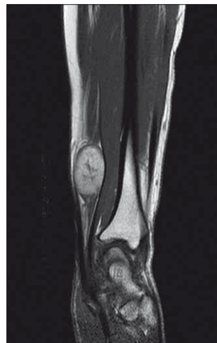
Obr. 2. MR vyšetření předloktí, T1W TSE sekvence po podání k.i. Multihance v sagitální rovině, nález benigního schwannomu nervus medianus.

onkologické péče Masarykova onkologického ústavu, Brno. Zde byl léčen chemoterapií dle Euro Ewing protokolu, v režimu VIDE (vinkristin, ifosfamid, doxorubicin, etoposide) a následně v režimu VAS (vinkristin, aktinomycin, ifosfamid). Léčba byla doplněna konvenční radioterapií na lůžko tumoru v dávce 50 Gy. Pacient je po pěti letech od operace doposud v remisi, bez známek recidivy procesu, je sledován pomocí PET/CT. V souladu s literárními údaji tvořily naprostou většinu tumorů v našem souboru benigní schwannomy, celkem ve 20 případech. Jednou šlo o neurofibrom, jednou o intraneurální ganglionovou cystu. Pokud vynecháme výše uvedený Ewingův sarkom a operační zákroky pro zánětlivé postižení, tak v případě zbylých 22 operací došlo pouze ve dvou případech k pooperačnímu zhoršení neurologického stavu (tab. 2). Jednou se jednalo o lehkou parézu (dle funkčního svalového testu stupně 4), jednou o trvalou hypestezii. V ostatních případech klinické obtíže prakticky vymizely, u některých pacientů s přechodnými pooperačními dysesteziemi a paresteziemi v příslušném dermatomu. V souboru operovaných pacientů nebyly zaznamenány žádné jiné pooperační komplikace.