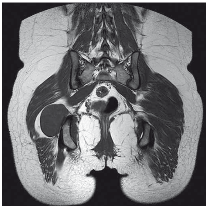
Obr. 3. MR pánve, T1W TSE sekvence v koronární rovině, plexiformní schwannom n. ischiadicus těsně za výstupem z foramen infrapiriforme.