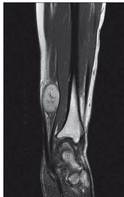
Obr. 2. MR vyšetření předloktí, T1W TSE sekvence po podání k.i. Multihance v sagitální rovině, nález benigního schwannomu nervus medianus.

onkologické péče Masarykova onkologického ústavu, Brno. Zde byl léčen chemoterapií dle Euro Ewing protokolu, v režimu VIDE (vinkristin, ifosfamid, doxorubicin, etoposide) a následně v režimu VAS (vinkristin, aktinomycin, ifosfamid). Léčba byla doplněna konvenční radioterapií na lůžko tumoru v dávce 50 Gy. Pacient je po pěti letech od operace doposud v remisi, bez známek recidivy procesu, je sledován pomocí PET/CT. V souladu s literárními údaji tvořily naprostou většinu tumorů v našem souboru benigní schwannomy, celkem ve 20 případech. Jednou šlo o neurofibrom, jednou o intraneurální ganglionovou cystu. Pokud vynecháme výše uvedený Ewingův sarkom a operační zákroky pro zánětlivé postižení, tak v případě zbylých 22 operací došlo pouze ve dvou případech k pooperačnímu zhoršení neurologického stavu (tab. 2). Jednou se jednalo o lehkou parézu (dle funkčního svalového testu stupně 4), jednou o trvalou hypestezii. V ostatních případech klinické obtíže prakticky vymizely, u některých pacientů s přechodnými pooperačními dysesteziemi a paresteziemi v příslušném dermatomu. V souboru operovaných pacientů nebyly zaznamenány žádné jiné pooperační komplikace.