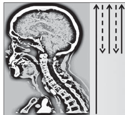
Obr. 1. Schéma průběhu skenování pomocí multifázické CT angiografie (Calgary Stroke Program protokol).

Z 200 pacientů zařazených do studie k 1. 9. 2014 byl přesun středočárových struktur \geq 5 mm přítomen u sedmi pacientů (3,5 %). Dva pacienti byli vyloučeni pro přítomnost artefaktů z pohybu znemožňující analýzu perfuzních dat. Průměrný věk ve skupině se středočárovým posunem \geq 5 mm byl 61 let (směrodatná odchylka, SD \pm 14 ), v kontrolní skupině 78 let (SD \pm 11 ). Mezi oběma skupinami nebyl signifikantní rozdíl ve sledovaných rizikových faktorech (hypertenze, diabetes mellitus, dyslipidemie, fibrilace síní či postižení koronárních tepen; tab. 1). Šest pacientů