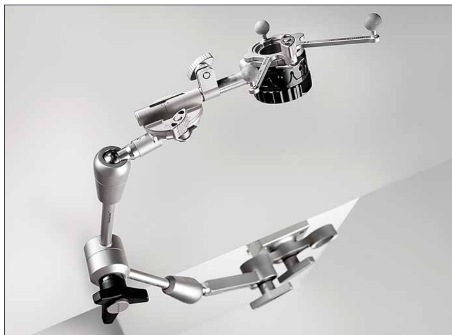
Obr. 1. Sestavený přístroj Varioguide. Fig. 1. Assembled Varioguide device.

Biopsie systémem Varioguide byly prováděny v celkovém znecitlivění, hlava upnutá ve třibodové svorce. Po registraci polohy hlavy bylo rameno Varioguide adjustováno