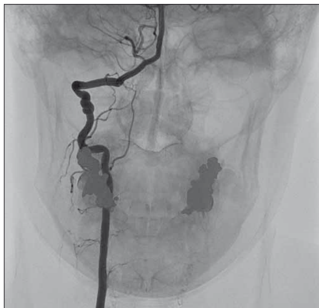
Obr. 3. Digitální subtrakční angiografie. Pravá a. vertebralis se známkami fibromuskulární dysplazie. Fig. 3. Digital subtraction angiography. Right vertebral artery with signs of fibromuscular dysplasia.