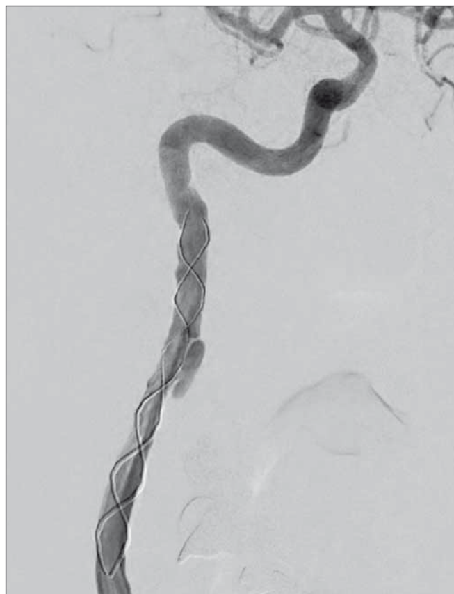
Obr. 4. Digitální subtrakční angiografie. Pravá a. carotis interna po endovaskulární léčbě. Fig. 4. Digital subtraction angiography. Right internal carotid artery after endovascular treatment.