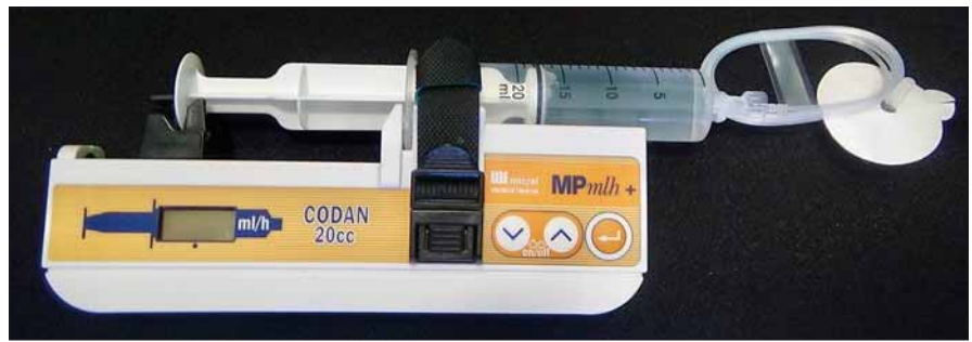
Obr. 4. Subkutánne podávanie apomorfínu pomocou pumpy (upravené podľa propagačného materiálu Micrel Medical Devices). Pumpa čerpajúca liečbu z pripojenej striekačky ukončená katétrom s tenkou ihlou.

Väčšina štúdií preukázala jeho efektivitu v redukcii „off“ stavov ako i prejavov viazaných na „off“ periód, ako napr. ranná dystónia, dysfágia a bolestivé „off“ stavy [150–152].