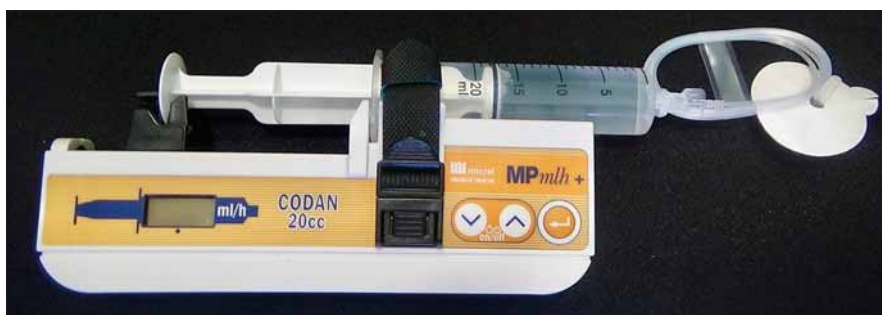
Obr. 4. Subkutánne podávanie apomorfínu pomocou pumpy (upravené podľa propagačného materiálu Micrel Medical Devices). Pumpa čerpajúca liečbu z pripojenej striekačky ukončená katétrom s tenkou ihlou.

Väčšina štúdií preukázala jeho efektívnosť v redukcii „off“ stavov ako i prejavov viazaných na „off“ periód, ako napr. ranná dystónia, dysfágia a bolestivé „off“ stavy [150–152].