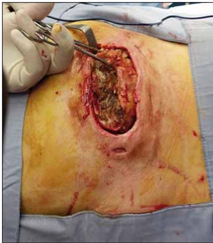
Obr. 1. Trochanterický dekubitus s pseudocystou.

Fig. 1. Trochanteric decubitus (pressure ulcer) with pseudocyst.