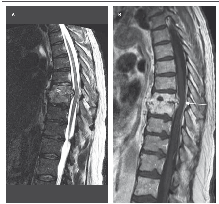
Obr. 2. MR vyšetření hrudní páteře u pacienta se spondylodiscitidou v etáži Th8/9 (pacient č. 3).

MR je diagnostická metoda první volby při podezření na SD. MR nám pomůže zároveň odlišit SD od degenerativních, traumatických či neoplastických změn. V časnějších stádiích onemocnění (2–8 týdnů od nástupu příznaků) má nativní RTG nízkou