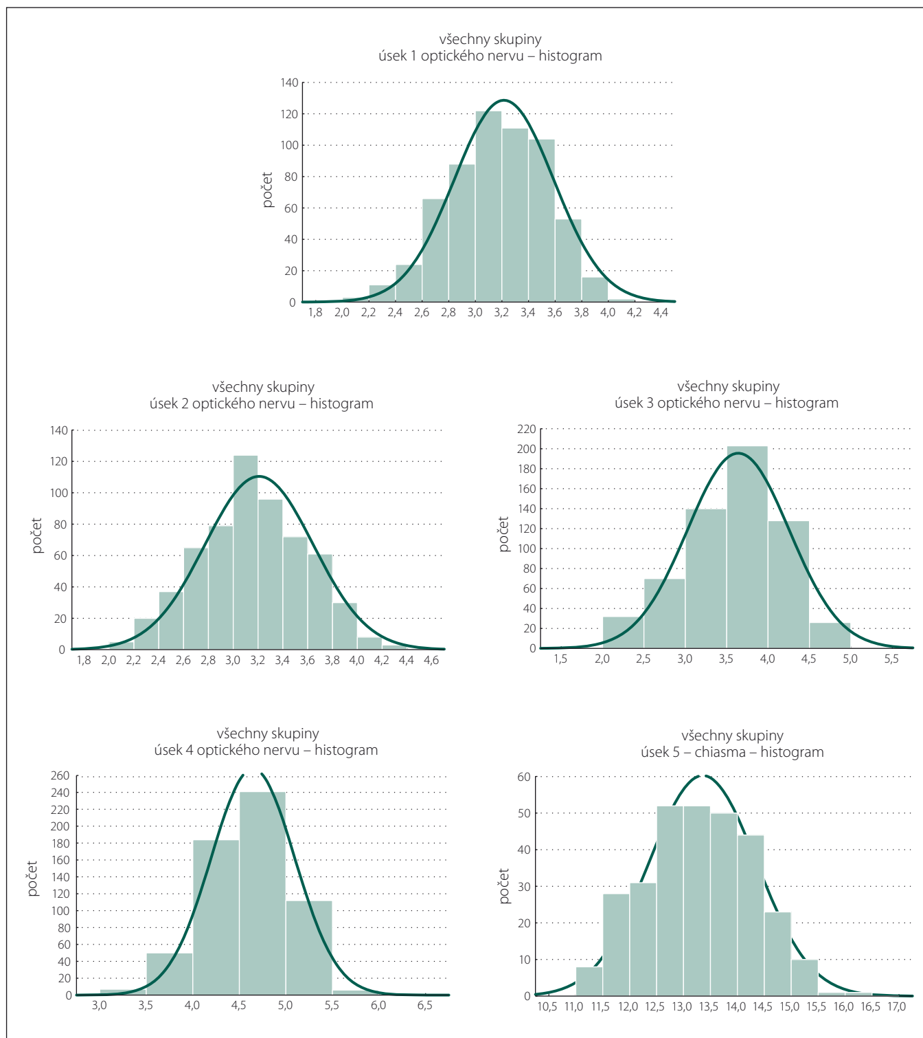
Obr. 2. Histogramy jednotlivých úseků optického nervu v celém souboru.

Fig. 2. The histograms of sections of the optic nerve in the whole set.