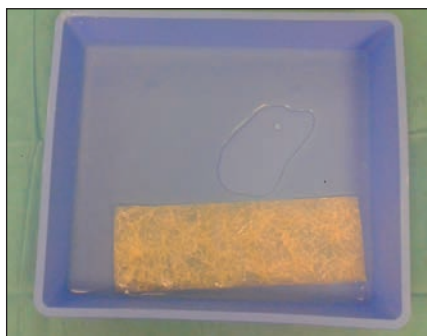
Obr. 1. Duralní grafit připravený k aplikaci po 2min naložení do fyziologického roztoku.

Fig. 1. The dural graft is ready to use after 2 min in rehydration fluid.