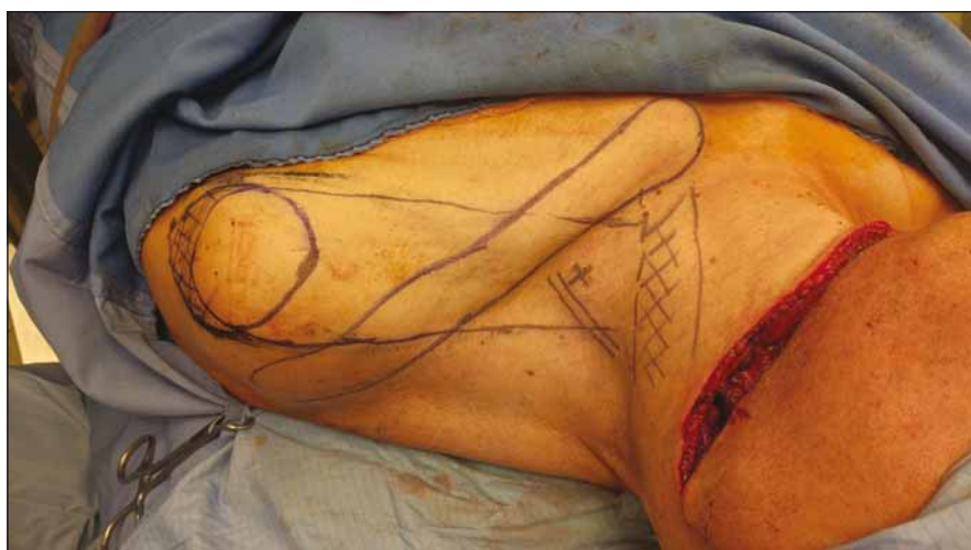
Obr. 2. Peroperační nářez laloku (pacient č. 1).

Fig. 1. Size and location of the tumor before surgery (patient No. 1).