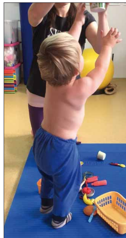
Obr. 2. Věk 2,5 roku, úchop předmětu ve vzpažení, patrný větší souhryb lopatky do abdukce a zevní rotace, než je odpovídající rozsahu pohybu do flexe v rameni pravé horní končetiny, stále lehce vážně supinace předloktí.

Fig. 2. Age 2.5 years, grip of the subject in elevation of upper arm, noticeable more movement of the scapula into abduction and external rotation than is the corresponding range of motion in flexion in the shoulder of the right upper limb, supination of the forearm still slightly falters.