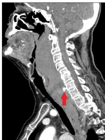
Obr. 1. CT sagitální řez ukazuje rozsáhlý hematoma a únik kontrastní látky v místě aktivního krvácení v úrovni C7 (šipka).

Fig. 1. CT sagittal scan showing massive haematoma with a contrast leak in the site of active bleeding at the level of C7 (arrow).