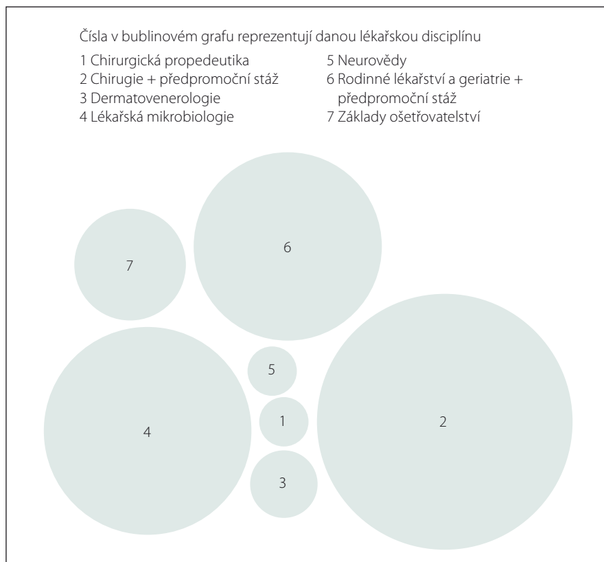
Obr. 2. Bublinový graf – rozložení lékařských disciplín, ve kterých se klíčové pojmy vyskytují.

Fig. 1. A cloud of key terms by frequency in the curriculum.