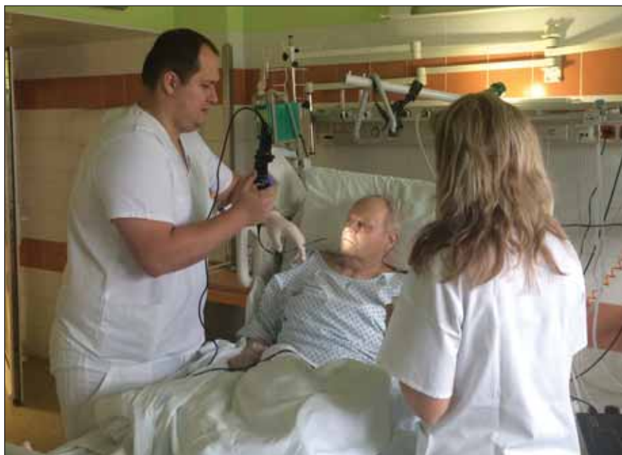
Obr. 1. Flexibilní endoskopické vyšetření polykání na neurologické jednotce intenzivní péče – neurolog a klinická logopedka.

Pacient byl vyšetřován minimálně v polosedě na lůžku, musel být schopen spolupráce. Nosní dírkou mu byl zaveden endoskop, bylo provedeno základní anatomické a neurologické zhodnocení orofaryngeální oblasti, následně bylo hodnoceno polykání slin, logopedkou podaného pyré, tekutiny a pevného sousta se zaměřením na detekci penetrace, aspirace nebo tiché aspirace. Pro zlepšení přehlednosti byly tekutina a pyré obarveny rozdílnými potravinářskými barvivy. Eventuální průnik/neprůnik materiálu do dýchacích cest byl hodnocen klinickou logopedkou a neurologem jednak přímo během výkonu a poté z videozáznamu pomocí Rosenbekovy penetračně aspirací škály (PAS) (tab. 1) [11]. Supervizi při hodnocení výkonů prováděl ORL speci-