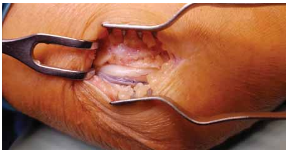
Obr. 2. Nervus ulnaris v sulcus nervi ulnaris humeri. Fig. 2. Ulnar nerve at the level of the medial epicondyle of the humerus.

(obr. 5). Po dokončení rozsáhlé dekomprese loketního nervu povolujeme tlak v manžetě, čímž před suturou rány zajistíme odhalení případného krvácení a jeho následnou pečlivou stázu. Výkon zakončujeme suturou podkoží a kůže, ke které využíváme kosmeticky výhodný intradermální steh (obr. 6). V případě peroperačního nálezu luxace či subluxe dekomprimovaného nervu nebo při lokální patologii (např. ganglion) v blízkosti průběhu nervu lze přistoupit k jeho transpozici s endoskopickou asistencí. V těchto případech však i my preferujeme konverzi na klasickou otevřenou techniku s mírným rozšířením řezu.