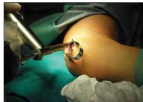
Obr. 3. Zavedení endoskopu s integrovaným reaktorem do proximální podkožní kapsy. Fig. 3. Retractor integrated endoscope is introduced into the proximal subcutaneous pocket.

tivně sledovaného souboru popsalo 90 % pacientů zlepšení či dokonce výrazné zlepšení. Jako stacionární hodnotilo svůj stav 9 % a jako zhoršený 1 % z operovaných. U těchto 10 % pacientů byl stav spojen buď s pooperační luxací nervu, double crush lézí nebo těžkým vstupním nálezem (McGowan III). Kontrolní EMG s tříměsíčním odstupem od operace absolvovalo 137 pacientů. U 89 % z nich byl pooperační elektrofyziologický nález hodnocen jako zlepšený, u 10 % jako stacionární a u 1 % ( n = 2 ) došlo ke zhoršení. Obě tato zhoršení byla přechodná a při další EMG s odstupem 10, resp. 15 měsíců od operace bylo prokázáno zlepšení bez nutnosti operační revize, a to i vzhledem ke zlepšenému klinickému stavu. Podezření na iatrogení lézi MACN bylo vysloveno u dvou pří-