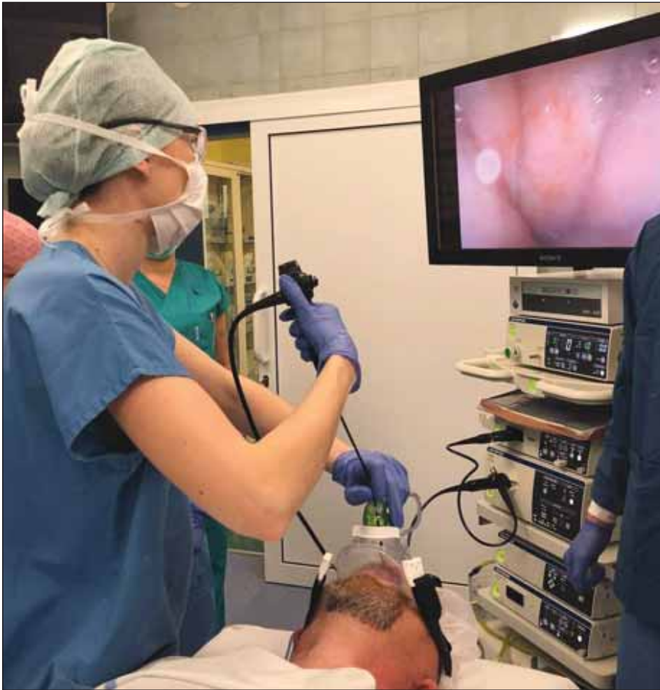
Obr. 1. Spánková endoskopie s přetlakovou ventilací, zevní pohled.

Fig. 1. Drug-induced sleep endoscopy with positive airway pressure; external view.