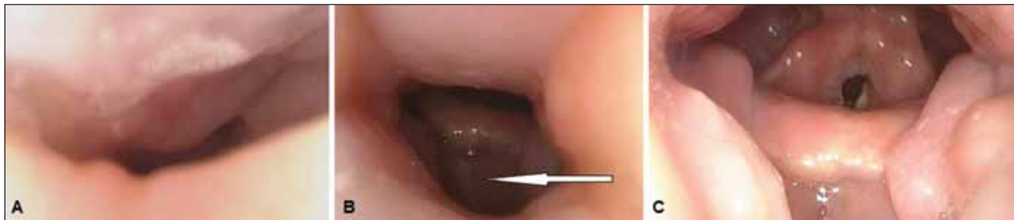
Obr. 3. Spánková endoskopie s přetlakovou ventilací, endoskopický pohled na horní dýchací cesty. (A) Předozadní obstrukce měkkého patra při tlaku 0 hPa; (B) stav horních dýchacích cest při tlaku 12 hPa – částečná obstrukce v oblasti měkkého patra a orofaryngu, přetrvávání úplné obstrukce kořene jazyka s útlakem epiglottis (šipka); (C) horní dýchací cesty volné ve všech etážích při tlaku 18 hPa.

Fig. 3. Drug-induced sleep endoscopy with positive airway pressure; endoscopic view of the upper airways. (A) Anteroposterior obstruction of the soft palate at a pressure of 0 hPa; (B) posture of the upper airways at a pressure of 12 hPa – partial obstruction in the area of the soft palate and oropharynx, and persistence of complete obstruction of the root of the tongue with the oppression of the epiglottis (arrow); (C) upper airways without obstruction in all sites at a pressure of 18 hPa.