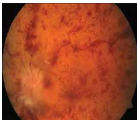
Obr. 1. Progrese edému papily a nárůst počtu hemoragií při sekundární okluzi centrální retinální vény.

Na Oční kliniku byla v květnu 2020 odeslána 73letá pacientka s týden trvajícím poklesem vidění levého oka a bolestí levé poloviny hlavy. Dosud neprodělala závažnější oční onemocnění. Před 7 měsíci u ní byla