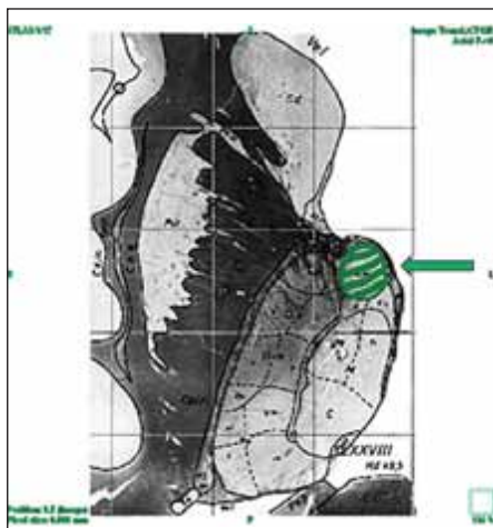
Obr. 1. Poloha nucleus anterior thalami (ohraňováno zeleně) ve vztahu ke strukturám komorovému systému (převzato z elektronického atlasu Schaltenbrand Bailey).

Pro studii byly využity preparáty Anatomického ústavu LF MU v Brně s provedeným nástřikem nitrolebních arterií a žil primárně připravené pro edukační kurzy zaměřené na neurochirurgické a otorinolaryngologické operační přístupy.