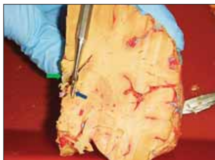
Obr. 2. Koronární řez mozku v úrovni nucleus anterior thalami – pátradlo ukazuje průběh transventrikulární trajektorie do nucleus anterior thalami (modrá šipka). V blízkosti zamýšlené trajektorie patrna subependymální žíla ve stropu postranní komory (zelená šipka).

Fig. 1. The position of the anterior thalamic nucleus (green borders) and its relationship to the structures of the ventricular system (modified from the Schaltenbrand Bailey e-atlas).