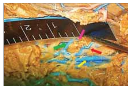
Obr. 6. Měření šířky koridoru mezi v. thalamostriata (fialová šipka) a plexus chorioideus (v. chorioidea superior – červená šipka) na druhé straně preparátu na základě srovnání šířky cévního koridoru (lze odhadnout na 2,5–3 mm) s průměrem zavedené sondy (1,3 mm). Patrný v. cerebri interna (žlutá šipka).

Po průchodu přes strop postranní komory stimulační elektroda prochází po-