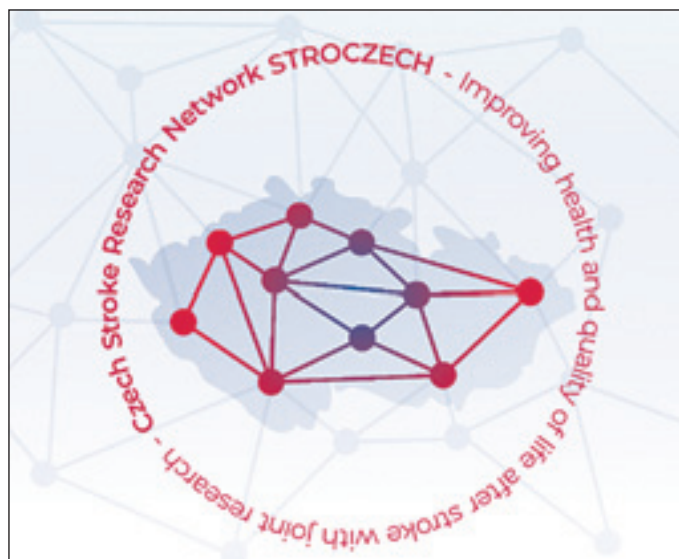
Obr. 3. Mikulenk P et al.

Podpořeno sítí STROCZECH v rámci výzkumné infrastruktury CZECRIN (č. projektu LM2023049), financované státním rozpočtem České republiky.