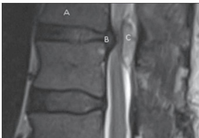
Obr. 1. MR, mediální řez, T2 vážený obraz: (A) tělo Th11, (B) hernie Th11/12, (C) sekvestr.

Fig. 1. MRI, medial plane, T2-weighted image: (A) Th11 body, (B) hernia Th11/12, (C) sequester.