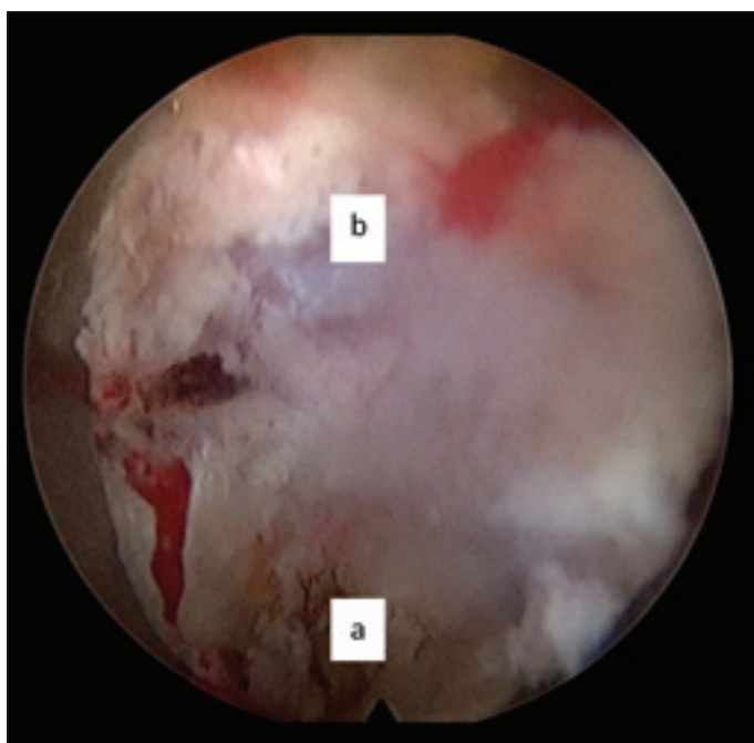
Obr. 2. Transforaminální přístup: (a) prostor ploténky; (b) páteřní kanál.

Fig. 2. Transforaminal approach: (a) intervertebral disc space; (b) spinal canal.