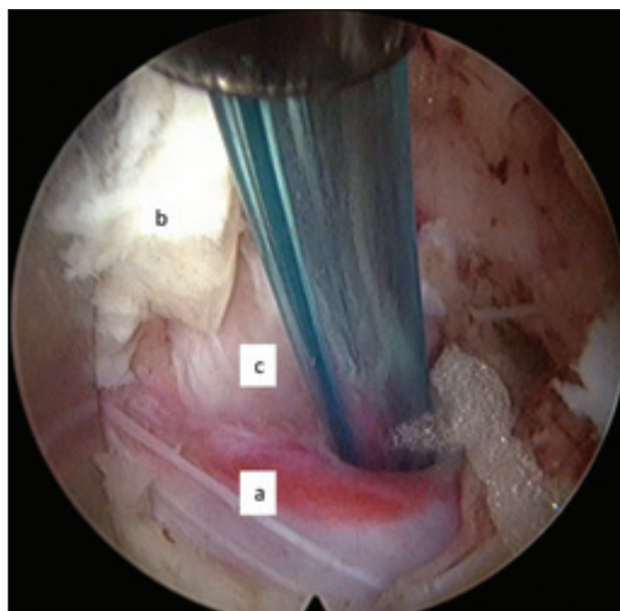
Obr. 3. Translaminární přístup: (a) odstupující nervový kořen; (b) ligamentum flavum; (c) exstirpovaný sekvestr.

Fig. 2. Transforaminal approach: (a) intervertebral disc space; (b) spinal canal.