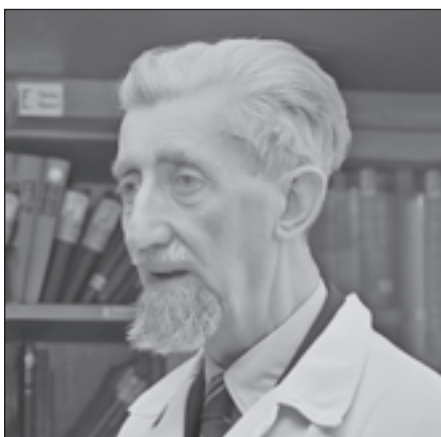
Obr. 4. Vladimír Vondráček.

Vladimír Vondráček (1895–1978) byl univerzitní profesor, přední český psychiatr a psycholog. V průběhu svého lékařského života se věnoval i internímu lékařství a farmakologii. V letech 1939–1942 a 1945–1978 působil na Psychiatrické klinice 1. LF UK a VFN. V roce 1958–1970 byl přednostou této kliniky. V průběhu života vydal řadu knih, nejznámější z nich je patrně trilogie vzpomínek: Lékař vzpomíná (1973), Lékař dále vzpomíná (1978) a Konec vzpomínání (1988).