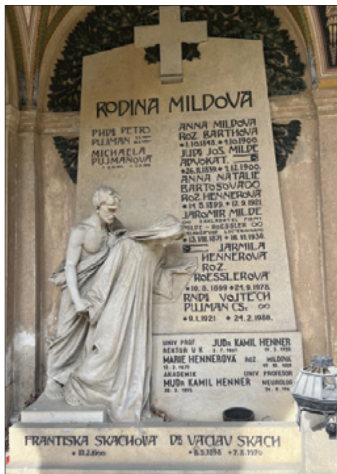
Obr. 11. Hrobka Hennerových na pražském Vyšehradě.