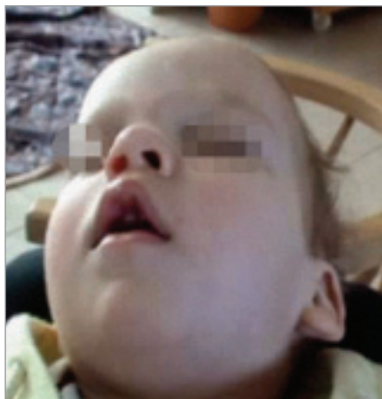
Obr. 1. Drobné odchylky kraniofaciálního skeletu spojené s rizikem rozvoje OSA – deviace nosního septa, vysoké úzké tvrdé patro, 1. pacient.

1,5letý chlapec s výraznými prenatálními a perinatálními rizikovými faktory měl v rámci základního onemocnění opožděný psychomotorický vývoj, v objektivním nálezu byla levostranná centrální hemiparéza. Od 4 měsíců věku se vyskytovaly četné epileptické záchvaty fokální se sekundární generalizací, změny antiepileptické medikace nevedly k dosažení kompenzace (trojkom-