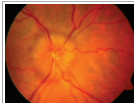
Obr. 3a, 3b. Chronická fáze papiledému.