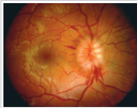
Obr. 2a, 2b. Fáze rozvinutého městnání.