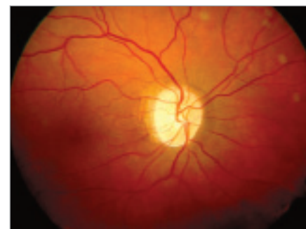
Obr. 4. Pozdní fáze, přechod k atrofii terče.