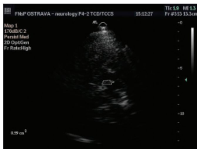
Obr. 2. Transkraniální sonografické vyšetření – měření obsahu substantia nigra, echogenita stupeň III, obsah 0,59 cm².

1 – a. cerebri media, 2 – malé křídlo sfenoidální kosti, 3 – horní hrana pyramidy, 4 – mesencephalon, 5 – substantia nigra, 6 – perimezencefalické cistry, 7 – třetí komora, 8 – mozeček