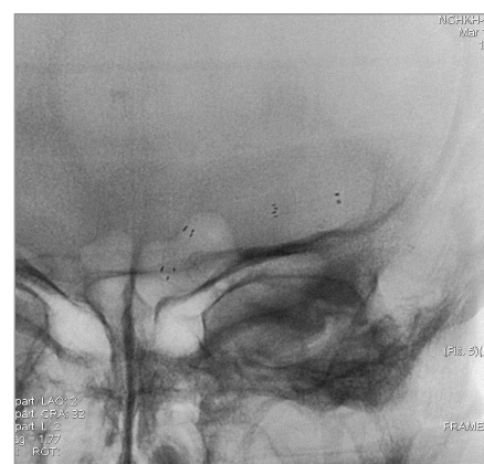
Obr. 4. Nativní snímek implantovaných stentů.

extrémně vinutá přístupová cesta a zavedení stentu je technicky neschůdné. Výsledky samotné angioplastiky, hodnocené v retrospektivní studii u 120 nemocných, ukazují benefit této léčby u nemocných refrakterních k medikamentózní terapii, kdy během ročního sledování došlo k 3,2 % ischemických příhod v léčené oblasti [7].