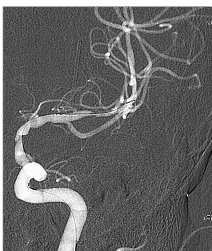
Obr. 2. DSA po předdilataci balonkem, před implantací stentů.

Intrakraniální sklerotické léze jsou dynamické, mohou progredovat i regredovat