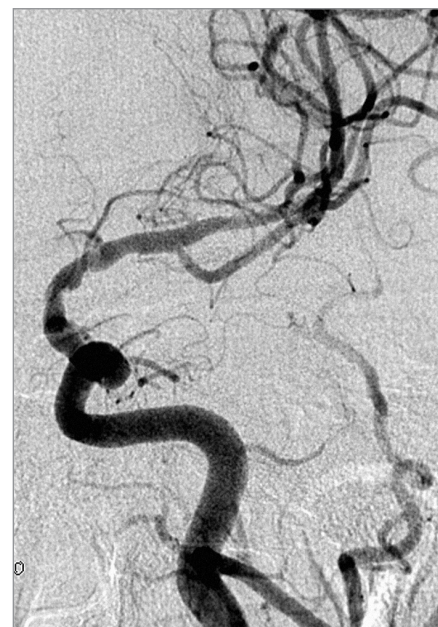
Obr. 3. Kontrolní DSA po implantaci dvou Wingspan stentů.

3 dny před výkonem je v elektivních případech podána duální antiagregační terapie klopido-grelem (Plavix, 75 mg/den) a acetylsalicylovou kyselinou (Anopyrin 100 mg/den). Výkony jsou většinou prováděny z třísla, v místním znecitlivění nebo v celkové anestezii v závislosti na zvyklostech pracoviště. Na začátku výkonu je podáván heparin v bolusu buď podle váhy nemocného tak, aby ACT byl 250–300 s nebo, jako podáváme na našem pracovišti, 5 000 j. v bolusu intravenózně. K průchodu lézí je vhodné použít mikrokateétr s jemným mikrovodičem a teprve po výměně za tužší vodič, který umožňuje větší podporu, zavést balonek k předdilataci a poté implantovat stent. Předdilatace je prováděna velmi pomalu, rychlostí zhruba 1 atm za 30 s, pro vysokou tendenci k disekci, tlak k inflaci by neměl překročit 7 atm [21,9]. Samotná angioplastika bez implantace stentu je možná tam, kde je