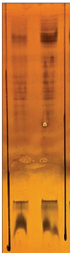
Obr. 2. Oligoklonální IgG pásy v mozkomíšním moku (vpravo) bez odpovídajících páسů v séru (vlevo) u pacienta s LHON.

Obrázek laskavě poskytl RNDr. Ing. Petr Kelbich z imunologického pracoviště Zdravotního ústavu se sídlem v Ústí nad Labem, Odboru laboratorní imunologie.