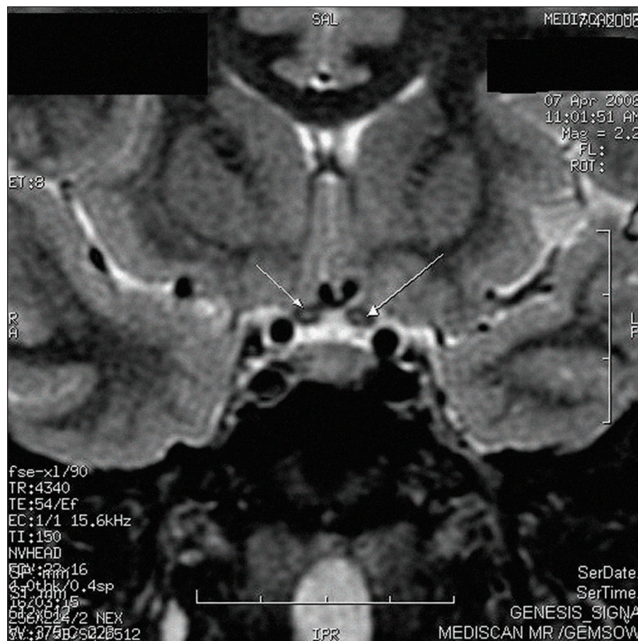
Obr. 1. Magnetická rezonance mozku s diskretními tečkovitými hypersignálními ložisky v optických nervech a chiazmatu na koronárním řezu na sekvencích FSTIR.

Porucha zraku se typicky objevuje mezi 15. až 35. rokem věku. Postižení začíná bezbolestně nejdříve na jednom oku. Za několik týdnů či měsíců (průměrně osm týdnů) se rozvine i na oku druhém, méně často na obou očích současně. Charakteristický výpadek zorného pole u LHON je centroekální skotom. Degenerací retinálních nervových vláken postupně dochází k atrofii zrakového nervu. Intenzita postižení zraku kolísá od nerozeznávání světla až k normálnímu vizu. U většiny pacientů je zrak horší než 6/60. Na očním pozadí může být v akutní fázi přítomna triáda: pseudoedém papily, cirkumpapilární telengiektatická mikroangiopatie, absence prosakování barviva z papily a cév při fluorescenční angiografii (FAG). U některých pacientů se však ani v akutní fázi nemusí tato triáda vyskytnout, proto její nepřítomnost LHON nevylučuje [4]. Magnetická re-