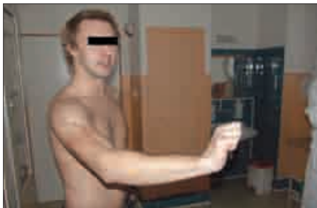
Obr. 3. Foto pacienta: dva roky po neurochirurgické operaci s dobrou funkcí n. radialis.