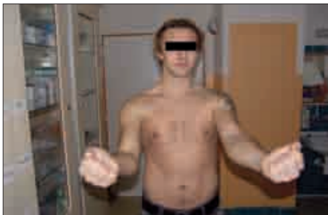
Obr. 2. Foto pacienta: dva roky po neurochirurgické operaci s patrnou dobrou funkcí n. musculocutaneus, dobrou trofikou bicepsu a viditelnou jizvou po revizi.

nus na periferii, dále i nepříjemné dysestetie na předloktí. Poté byl revidován za pět měsíců od původní ortopedické operace na naší klinice, provedena sutura end-to-end poškozených struktur nervu, resp. laterálního sekundárního fasciklu. Na kontrolních EMG vyšetřeních se objevily známky reinervace v zóně n. mu-