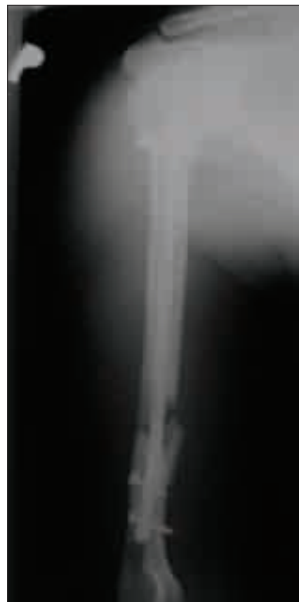
Obr. 1. Rentgenový snímek pravé pažní kosti po zajištěném hřebování.

Osmadvacetiletý muž byl operován na ortopedickém pracovišti operačním přístupem dle Bancarta pro opakované luxace ramenního kloubu. Při této operaci došlo k poranění n. musculocutaneus v blízkosti odstupe z laterálního sekundárního svazku, pacient si dále stěžoval na dysestetické obtíže v inervační zóně n. media-